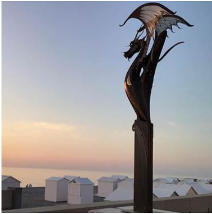
Le dragon « Imuginy ».