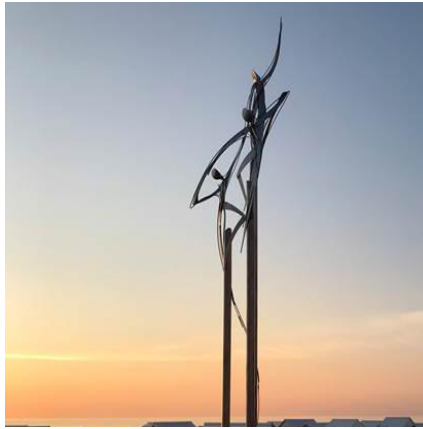
« La 3e personne ».