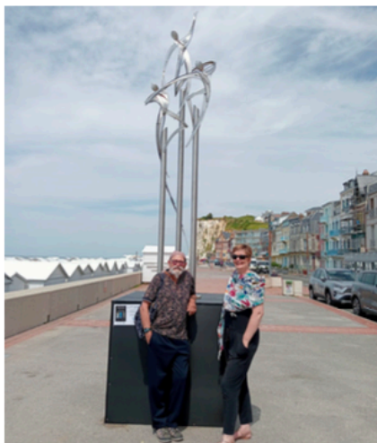
La 3ème personne