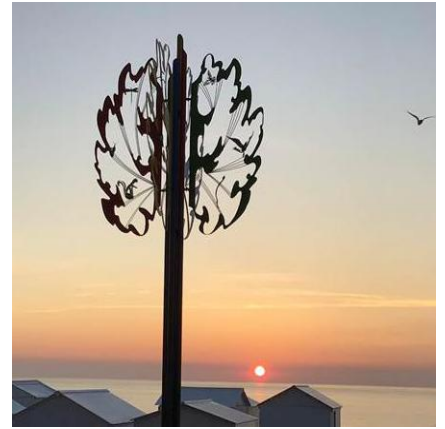
« Baliveaufaune ».